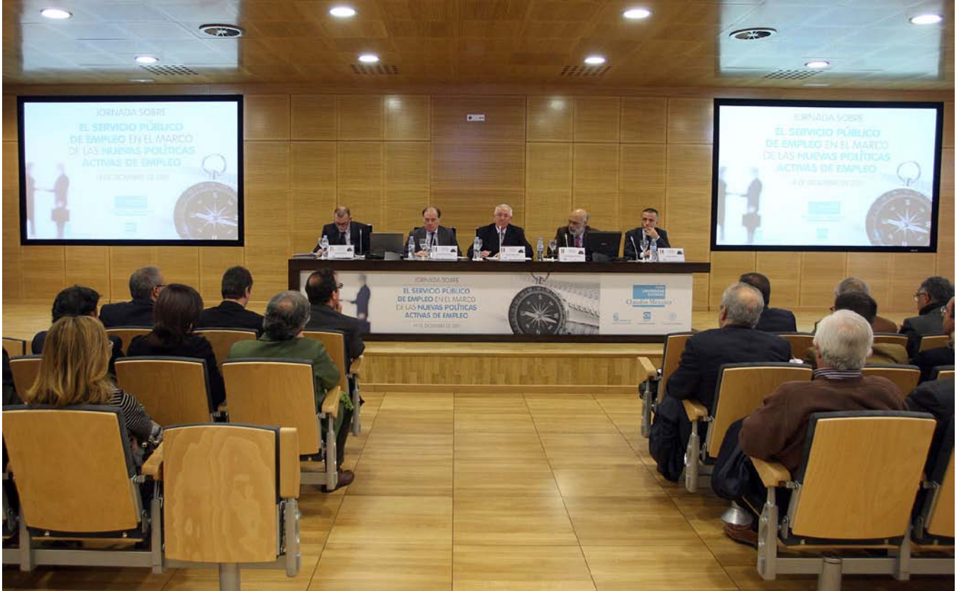
Un momento de la celebración del Foro sobre “ Servicio Público de Empleo en el marco de las nuevas Políticas Activas de Emple.”