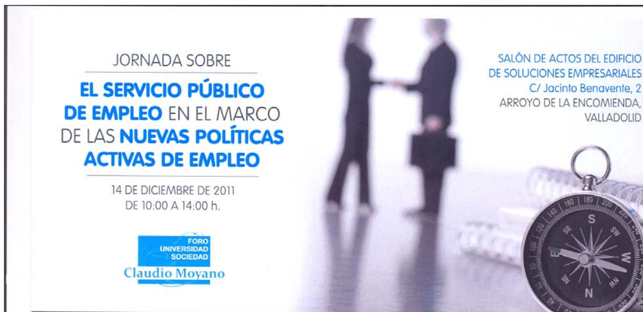
Portada del Programa de la Jornada sobre “El Servicio Público de Empleo en el marco de las nuevas Políticas Activas de Empleo

Este séptimo Foro tuvo lugar el día 14 de diciembre de 2011 en el Salón de Actos del Edificio de Soluciones Empresariales en Arroyo de la Encomienda, edificio perteneciente a la Consejería de Economía de la Junta de Castilla y León bajo el título “El Servicio Público de Empleo en el marco de las nuevas Políticas Activas de Empleo” .