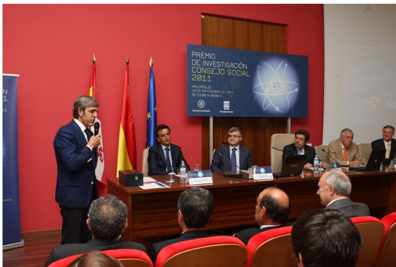
Momentos del Acto de la entrega de los Premios de Investigación “Consejo Social” 2011

Consciente de la importancia que para la Sociedad tiene el fomento de la investigación, del desarrollo científico y de la innovación tecnológica en la Universidad, el Consejo Social, en el año 2006, aprobó la constitución con carácter anual y carácter honorífico de los “PREMIOS DE INVESTIGACION CONSEJO SOCIAL”, y lo convocó en dos modalidades: de “ Empresa e Instituciones ” y de “ Departamentos, Institutos Universitarios y Grupos de Investigación Reconocidos ”, este último, está dotado con 12.000€ que deberán destinarse a la adquisición de medios materiales no inventariables relacionados con la actividad investigadora del galardonado o a la publicación o divulgación de la misma.