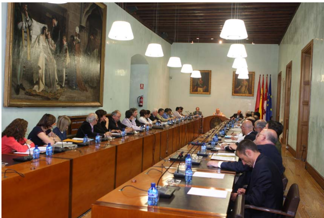
Desarrollo de una sesión plenaria del Consejo Social

El Consejo Social se articula desde este momento en cuatro Comisiones denominadas : Comisión de Economía, Patrimonio y Personal, Comisión Académica y de Calidad, Comisión de Relaciones con la Sociedad, y Comisión de Alumnos y Extensión Universitaria. Mención aparte merece la Comisión Permanente que, con funciones de coordinación y preparación de las sesiones plenarias, así como de información, asesoramiento y asistencia al Presidente estará presidida por el del Consejo Social, y de la que además forman parte el Rector, los Presidentes de las restantes Comisiones y el Secretario, que actuará como tal en ella, con voz pero sin voto.