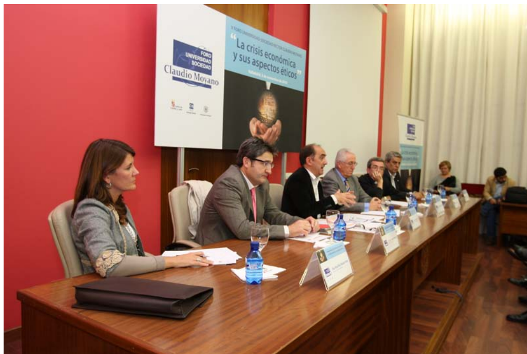
El desarrollo de la Mesa Redonda del Foro sobre “La crisis económica y sus aspectos éticos”.