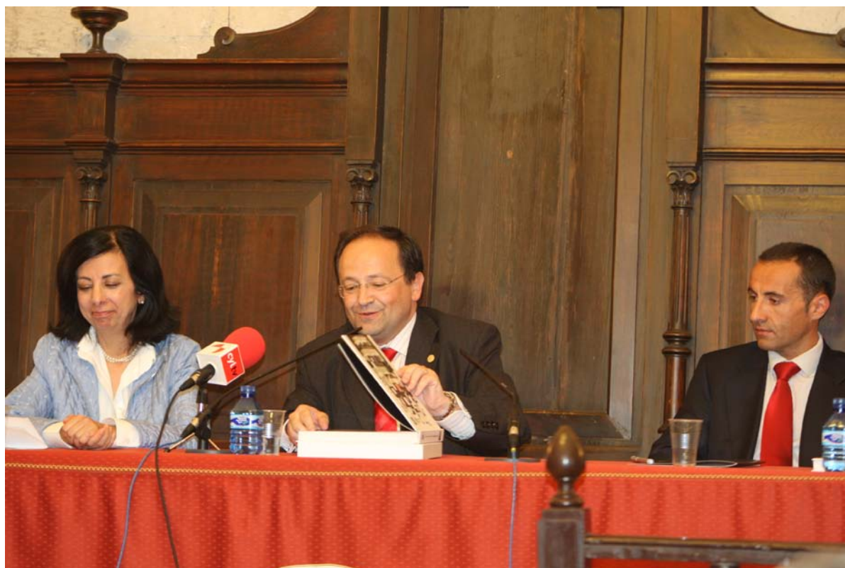
Acto del Presentación del libro “Locus Sapientiae: la Universidad de Valladolid en sus edificios”.

Dicho proyecto fraguó definitivamente en el año 2010, con la edición por parte del Consejo Social de un libro bajo el título “Locus Sapientiae: La Universidad de Valladolid en sus edificios” .