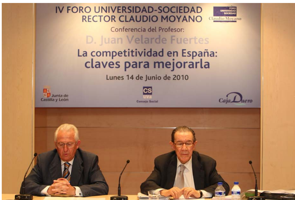
Un instante de la Conferencia del Foro sobre “La Competitividad en España: claves para mejorarla”.

Con alta asistencia de Autoridades y personalidades de diversas Instituciones y Estamentos de la Sociedad de Castilla y León, constituyó un éxito de asistencia por el interés social que suscita dicho tema.