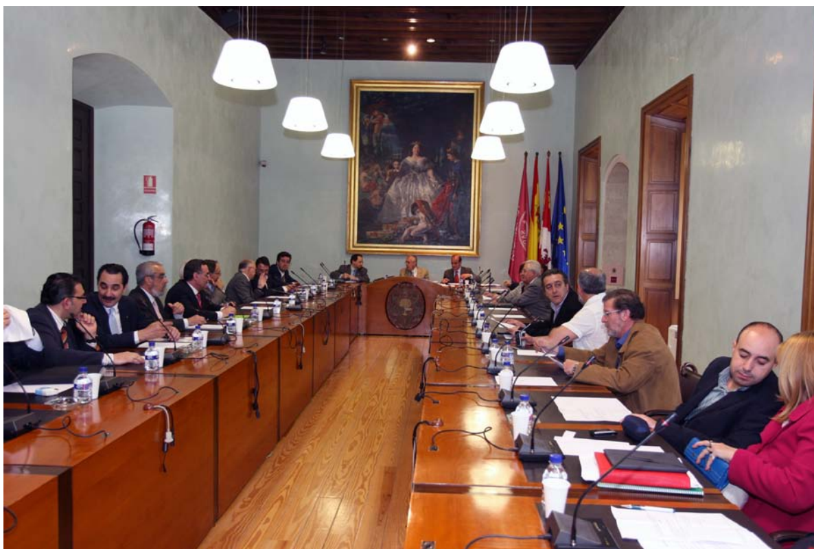
Desarrollo de una sesión plenaria del Consejo Social