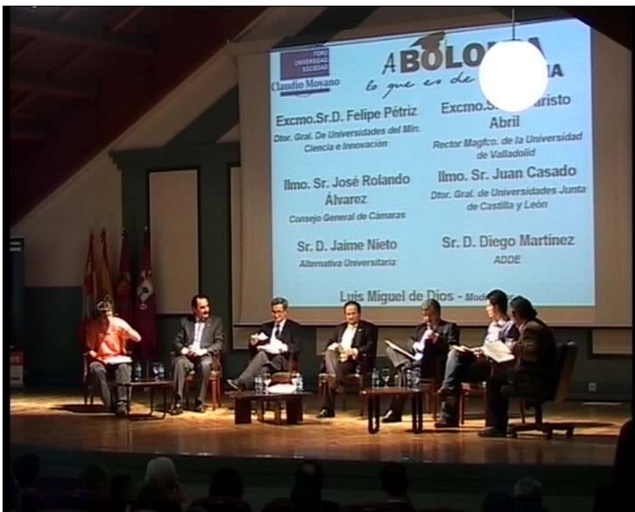
Un instante del debate en el desarrollo del Foro “A Bologna lo que es de Bologna”.

Director General de Universidades del Ministerio de Ciencia e Innovación.