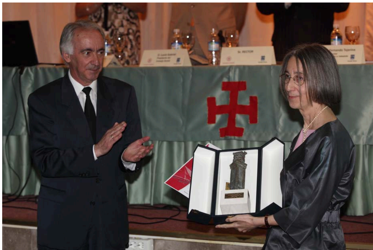
Entrega del Premio de Investigación “Consejo Social” 2009.- Modalidad Departamentos, Institutos Universitarios y G.I.R.- al Instituto de Historia Simancas.

El Acto de la entrega de dichos Premios, con la asistencia de diversas autoridades de los ámbitos social, universitario y empresarial, tuvo lugar el día 9 de julio de 2009, en el Salón de Actos del Colegio Mayor Masculino “Santa Cruz”.