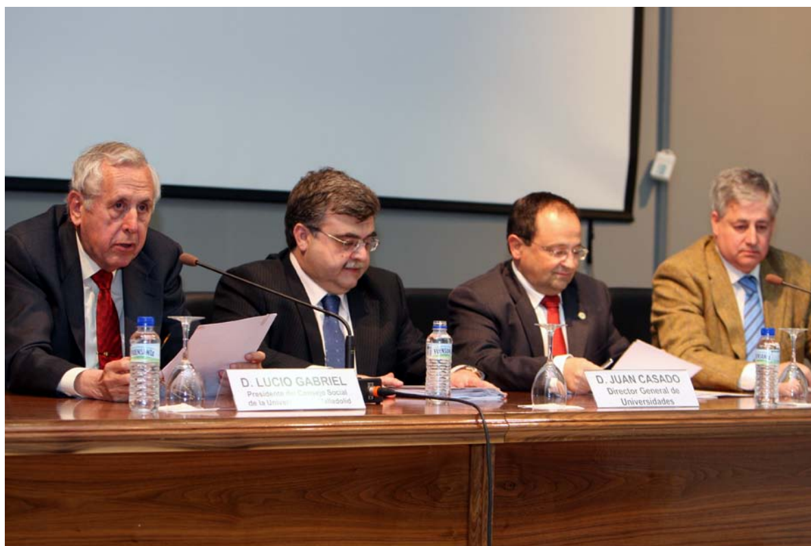
Instante de la Apertura y Presentación de la Jornada