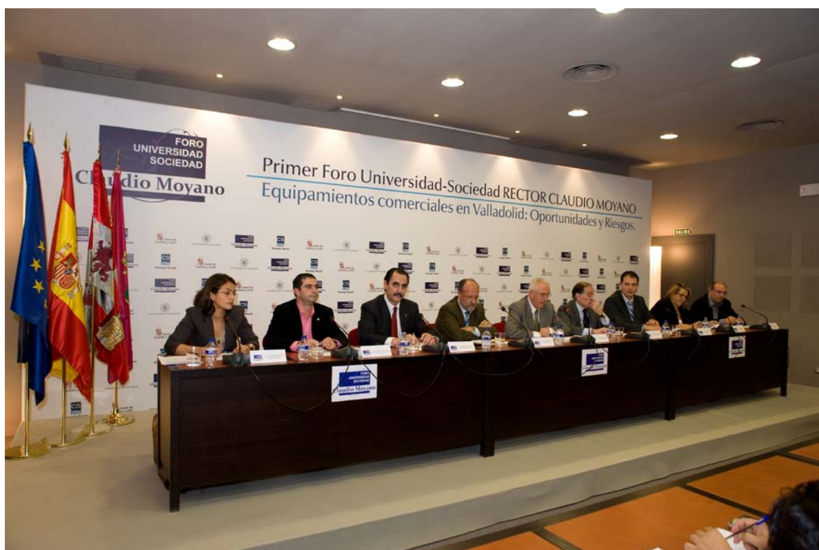
Celebración del Primer Foro Universidad-Sociedad “Rector Claudio Moyano”

Como desarrollo de dicho Protocolo, el 11 de noviembre de 2008, tuvo lugar en el Salón de Actos de la Delegación Territorial de la Junta de Castilla y León la celebración del Primer Foro Universidad-Sociedad “Rector Claudio Moyano”, bajo el título “ Equipamientos comerciales en Valladolid: Oportunidades y Riesgos ”.