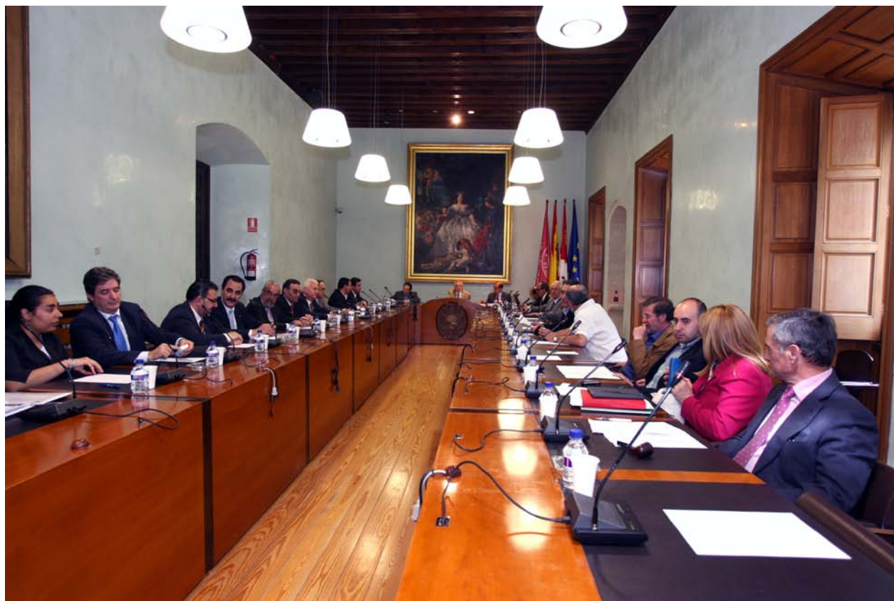
Un instante del desarrollo de una sesión plenaria del Consejo Social