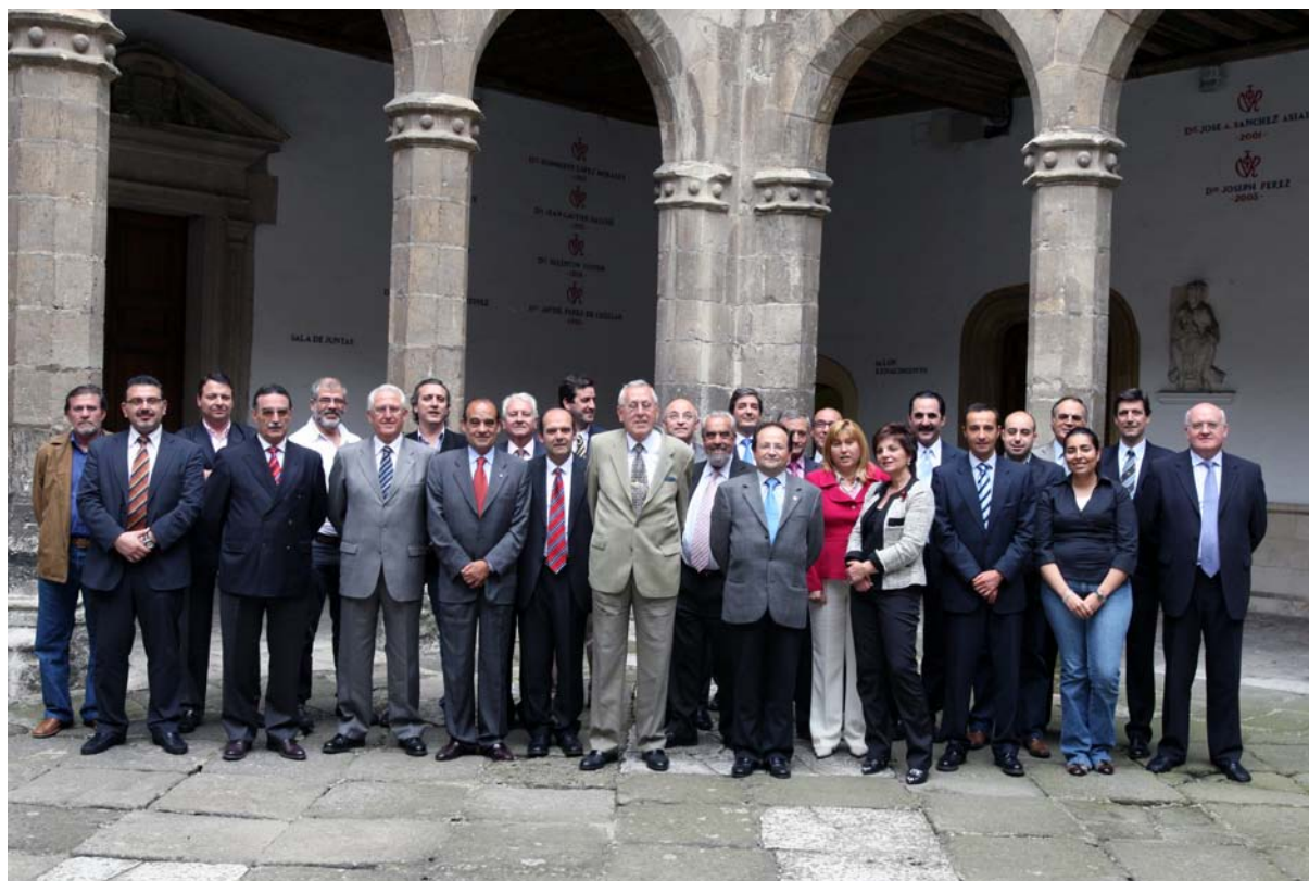
Composición, tras su constitución, del nuevo Consejo Social

A continuación el Presidente declaró formalmente constituido el Consejo Social de la Universidad de Valladolid y pronunció unas palabras de bienvenida a los nuevos Vocales, indicando que, por su trayectoria, van a enriquecer al Consejo Social, agradeciendo a todos su disposición para participar y asumir los trabajos con responsabilidad y exhortándoles a desempeñar sus tareas con el máximo interés, dedicación y colaboración en beneficio del Consejo Social y de nuestra Universidad.