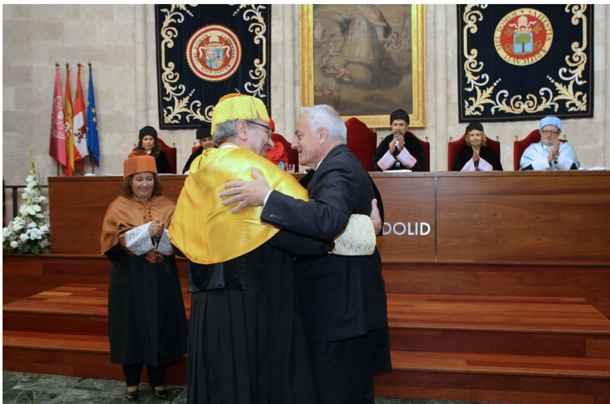
El galardonado recibe la felicitación el presidente del Consejo Social