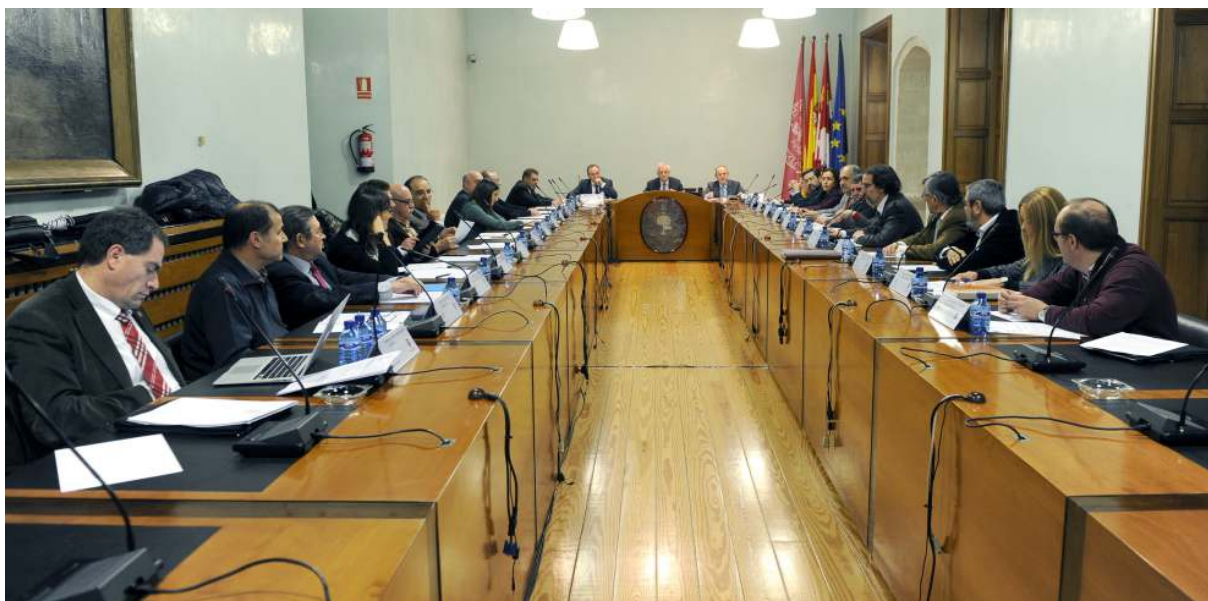
Sesión constitutiva del Pleno del nuevo Consejo Social

Así, en cumplimiento de la Orden EDU/985/2016, de 22 de noviembre, por el que se acuerda el cese y nombramiento de los miembros del Consejo Social de la Universidad de Valladolid (publicada en el Boletín Oficial de Castilla y León de fecha 29 de noviembre de 2016), el día 15 de diciembre se celebró el acto constitutivo del nuevo Consejo Social en la Sala de Juntas del Palacio de Santa Cruz de Valladolid.