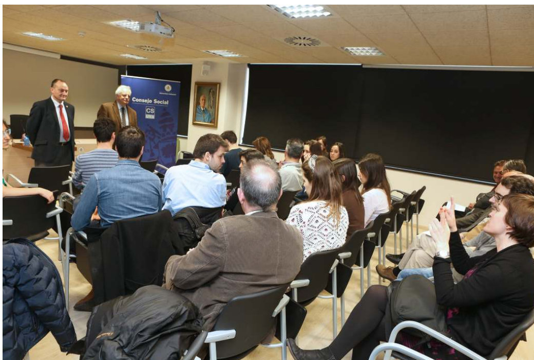
Intercambio de opiniones en la reunión con los becarios y sus tutores

La reunión tuvo lugar el 12 de abril en el Museo Universitario de Valladolid (MUVA) y en ella participaron el presidente del Consejo Social y el rector de la UVa.