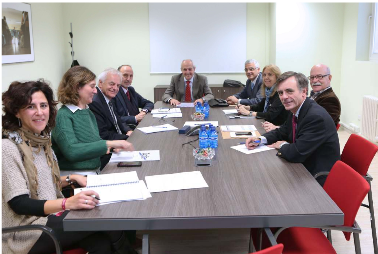
Primera reunión del Proyecto ADE “Foro Universidad-Empresa”

Para la puesta en marcha de este proyecto, representantes de los consejos sociales de las cuatro universidades públicas de la región y de la ADE mantuvieron el 12 de diciembre una primera reunión en Valladolid en la que fijaron el alcance, perímetro, contenido y resultados esperados del estudio sobre el futuro laboral de los estudiantes de las áreas de Ciencias Sociales, Artes y Humanidades a realizar en el ámbito de las cuatro Universidades.