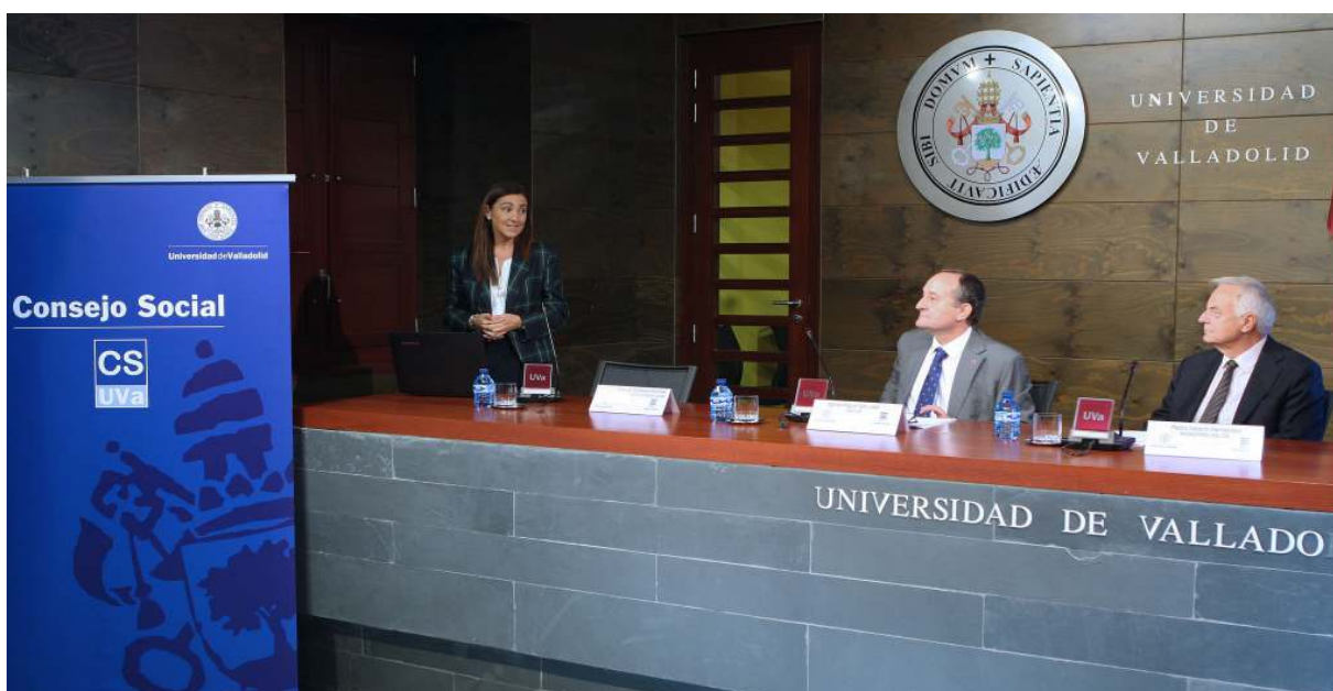
Presentación de uno de los proyectos premiados

El jurado estuvo integrado por los presidentes de las comisiones Académica, Económica y de Relaciones con la Sociedad del Consejo Social, el rector de la UVA, el vicerrector de Ordenación Académica e Innovación Docente, la vicerrectora de Estudiantes y el director del Área de Formación e Innovación Docente de la Universidad, el vocal del Consejo Social en representación de los Alumnos, así como por el secretario del Consejo Social.