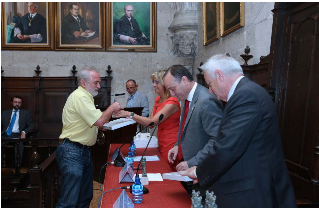
Los vocales recibieron un pequeño recuerdo de su paso por el Consejo Social

El presidente del Consejo Social destacó el carácter altruista del trabajo realizado por los vocales, dado que no reciben ninguna remuneración por su labor, llegando además a renunciar al cobro de dietas y primas de asistencia a Plenos y Comisiones para dotar las becas que concede el Consejo Social a estudiantes de la Universidad para que se inicien en tareas de investigación.