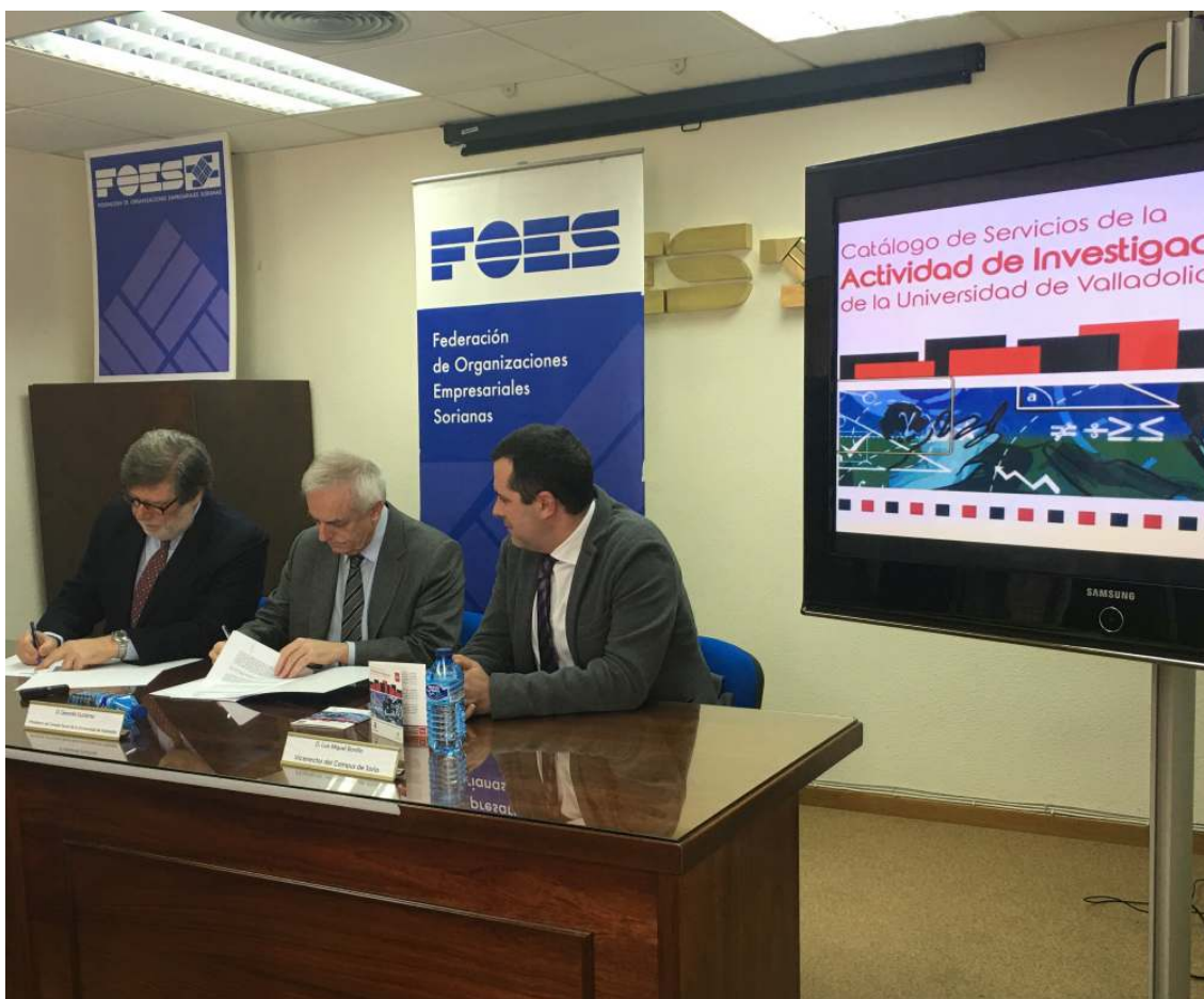
El presidente del Consejo Social y el presidente de FOE firman el convenio presencia del vicerrector del Campus de Soria

Además de estas organizaciones empresariales, el Consejo Social también procedió a difundir el Catálogo de Servicios entre los colegios profesionales, agrupaciones empresariales y clústeres de la región, a los que hizo llegar varios ejemplares para su distribución entre sus miembros.