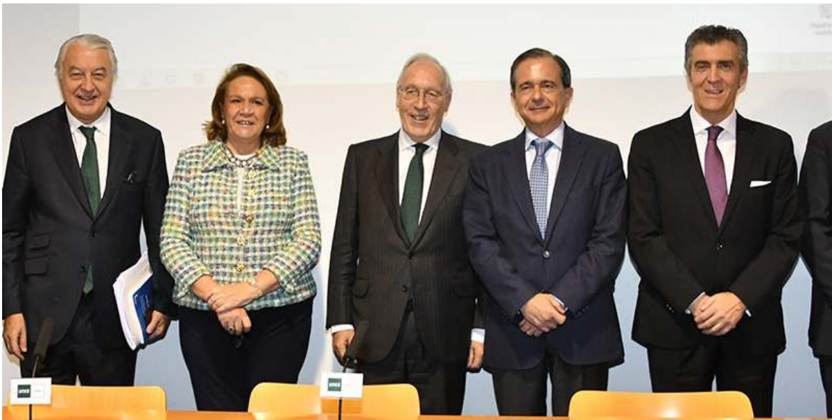
Nuevos miembros del Comité Ejecutivo de la CSSU con su presidente