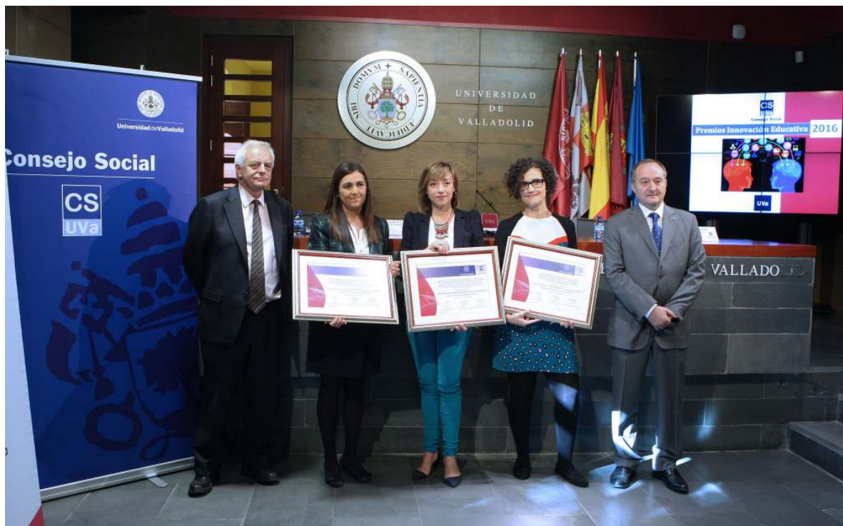
Foto de las premiadas con el presidente del Consejo Social y el rector de la UVA

El jurado estuvo integrado por los presidentes de las comisiones Académica, Económica y de Relaciones con la Sociedad del Consejo Social, el rector de la UVA, el vicerrector de Ordenación Académica e Innovación Docente, la vicerrectora de Estudiantes y el director del Área de Formación e Innovación Docente de la Universidad, el vocal del Consejo Social en representación de los Alumnos, así como por el secretario del Consejo Social.