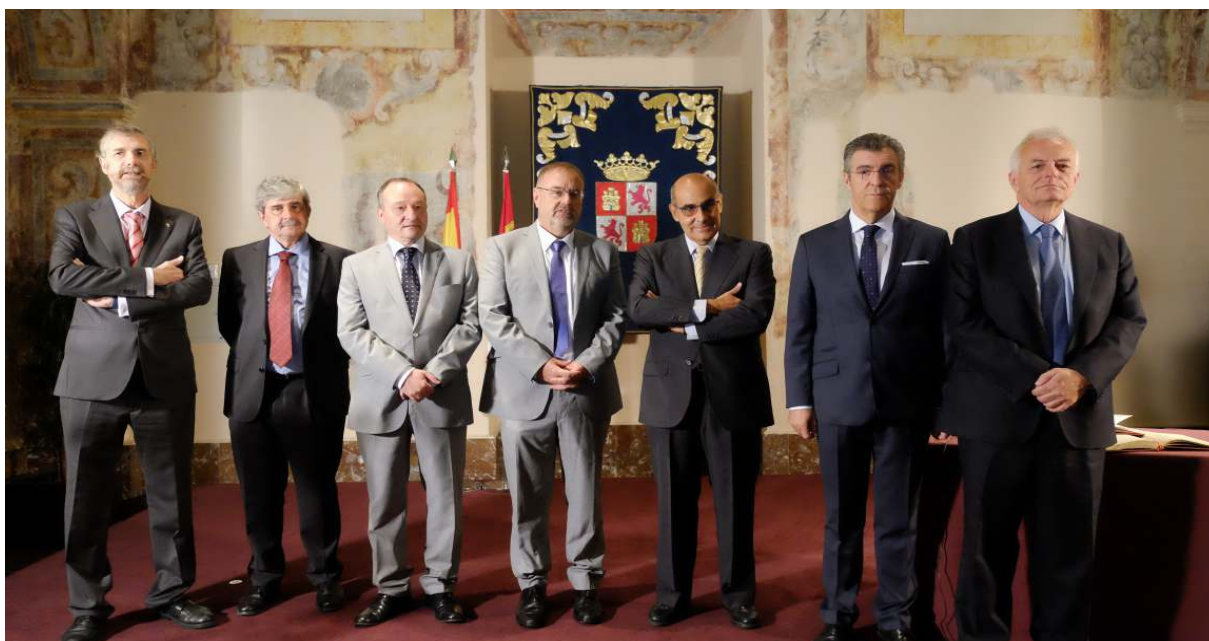
Acto de toma de posesión de los presidentes de los Consejos Sociales