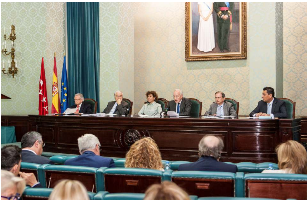
Asamblea General de la Conferencia de Consejos Sociales celebrada en mayo

La Asamblea General de la Asociación Conferencia de Consejo Sociales de las Universidades Españolas se reunió en el Paraninfo de la Universidad Politécnica de Madrid el 18 de mayo de 2016. A esta reunión asistieron en representación del Consejo Social de la Universidad de Valladolid su presidente y su secretario.