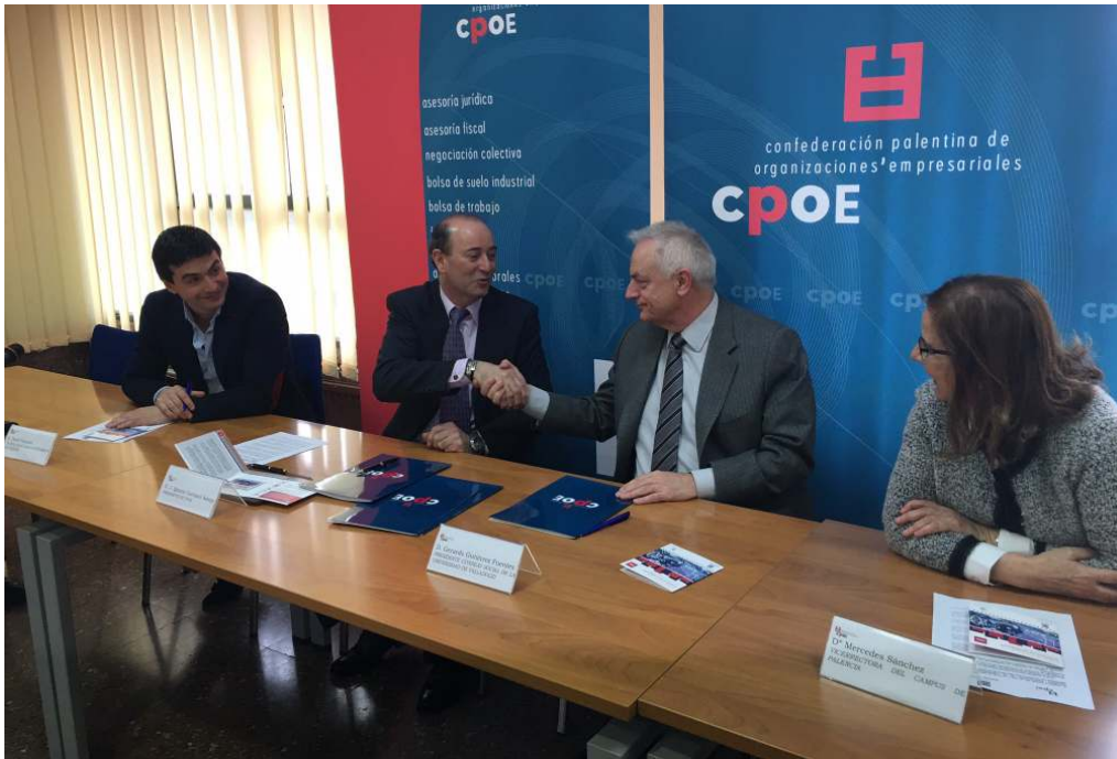
Firma del convenio de colaboración con la Confederación Palentina de Organizaciones Empresariales