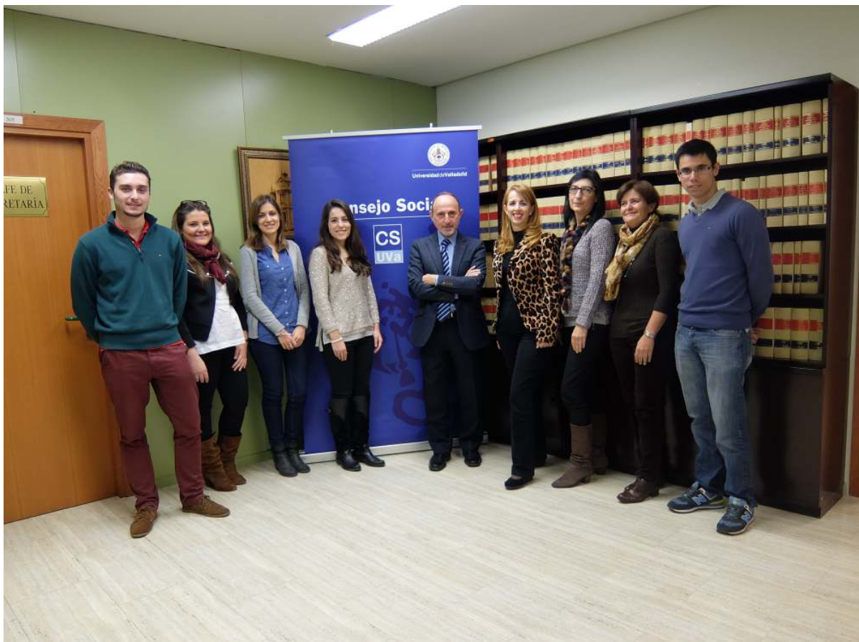
Visita del comité organizador del Premio “Empresario del Año” 2017 a la sede del Consejo Social

El acto de entrega de los Premios 2015 tuvo lugar en el transcurso de una cena-homenaje organizada el 3 de marzo de 2016 en el restaurante Las Lomas y a la que asistieron en representación del Consejo Social su presidente y el presidente de su Comisión de Relaciones con la Sociedad.