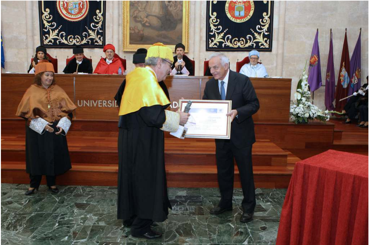
El presidente del Consejo Social hace entrega al premiado del diploma fedatario del galardón

Este grupo inició su labor en este campo en el año 1984 al asistir uno de sus miembros al nacimiento del primer indicador de calcio intracelular durante una estancia sabática en Cambridge. Conscientes del potencial de esta nueva herramienta, el grupo montó y mejoró la técnica en Valladolid, implementando en 1988 las medidas de microfluorescencia y análisis de imagen en células vivas, con resolución a nivel de célula individual.