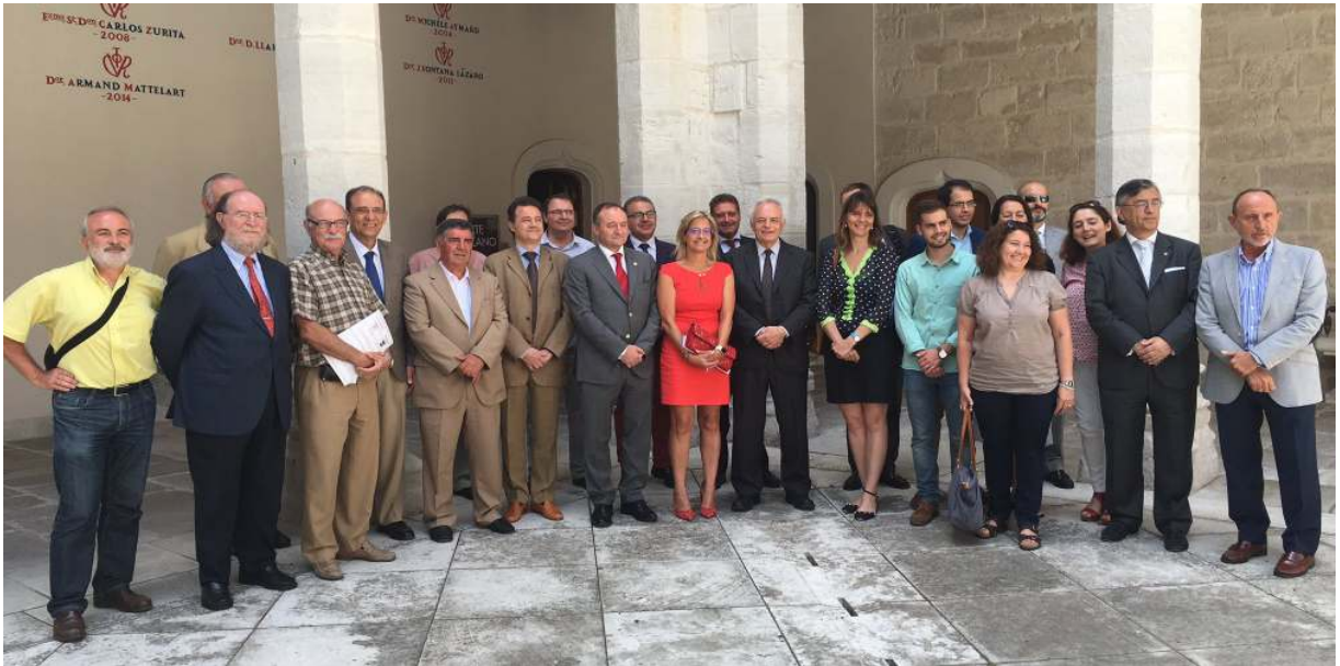
Participantes en el Acto de Homenaje a los vocales del Consejo Social

El presidente del Consejo Social destacó el carácter altruista del trabajo realizado por los vocales, dado que no reciben ninguna remuneración por su labor, llegando además a renunciar al cobro de dietas y primas de asistencia a Plenos y Comisiones para dotar las becas que concede el Consejo Social a estudiantes de la Universidad para que se inicien en tareas de investigación.