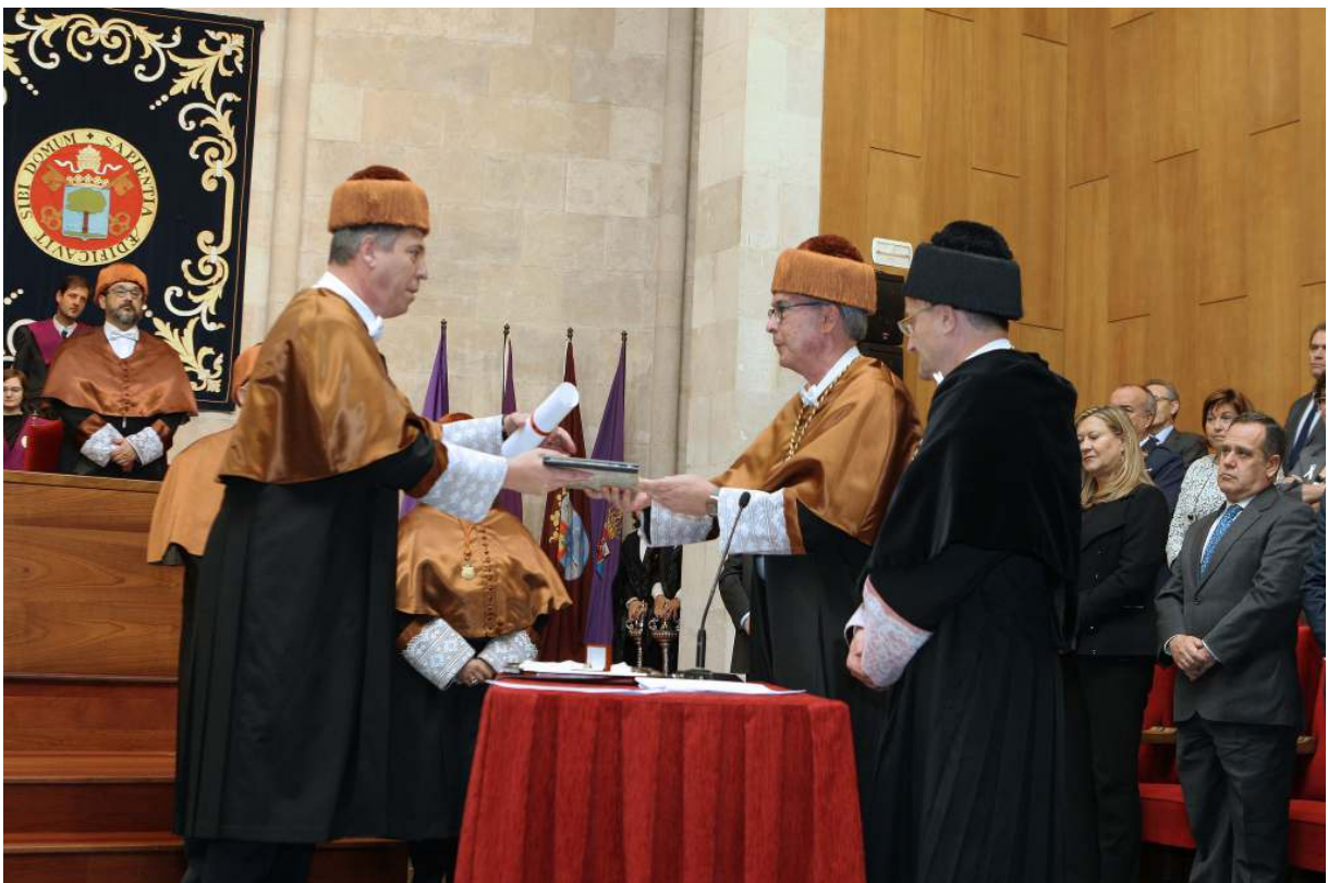
Entrega de credenciales como Doctor Honoris Causa

También resaltó su vocación constante hacia el mundo del automóvil, sector estratégico en Valladolid y en Castilla y León, su carácter castellano y defensor de los valores de esta región, su vocación universal de español en el mundo y el carácter humanista de su persona.