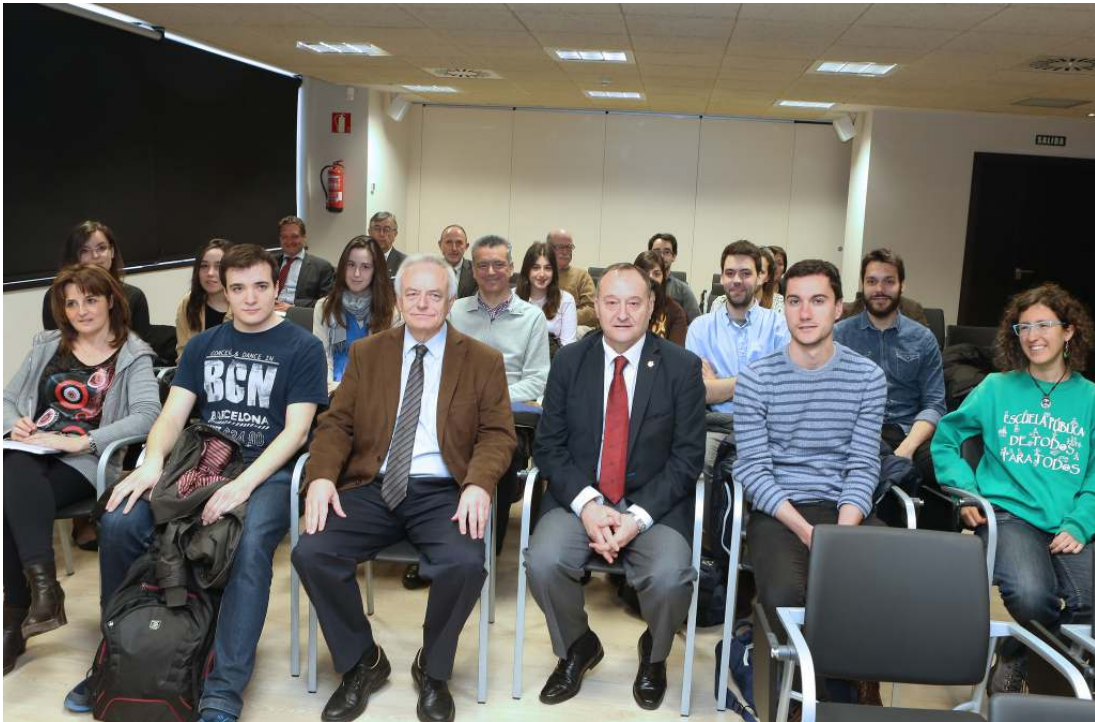
El presidente del Consejo Social y el rector de la UVa, en la reunión con los becarios 2015-2016

La reunión tuvo lugar el 12 de abril en el Museo Universitario de Valladolid (MUVA) y en ella participaron el presidente del Consejo Social y el rector de la UVa.