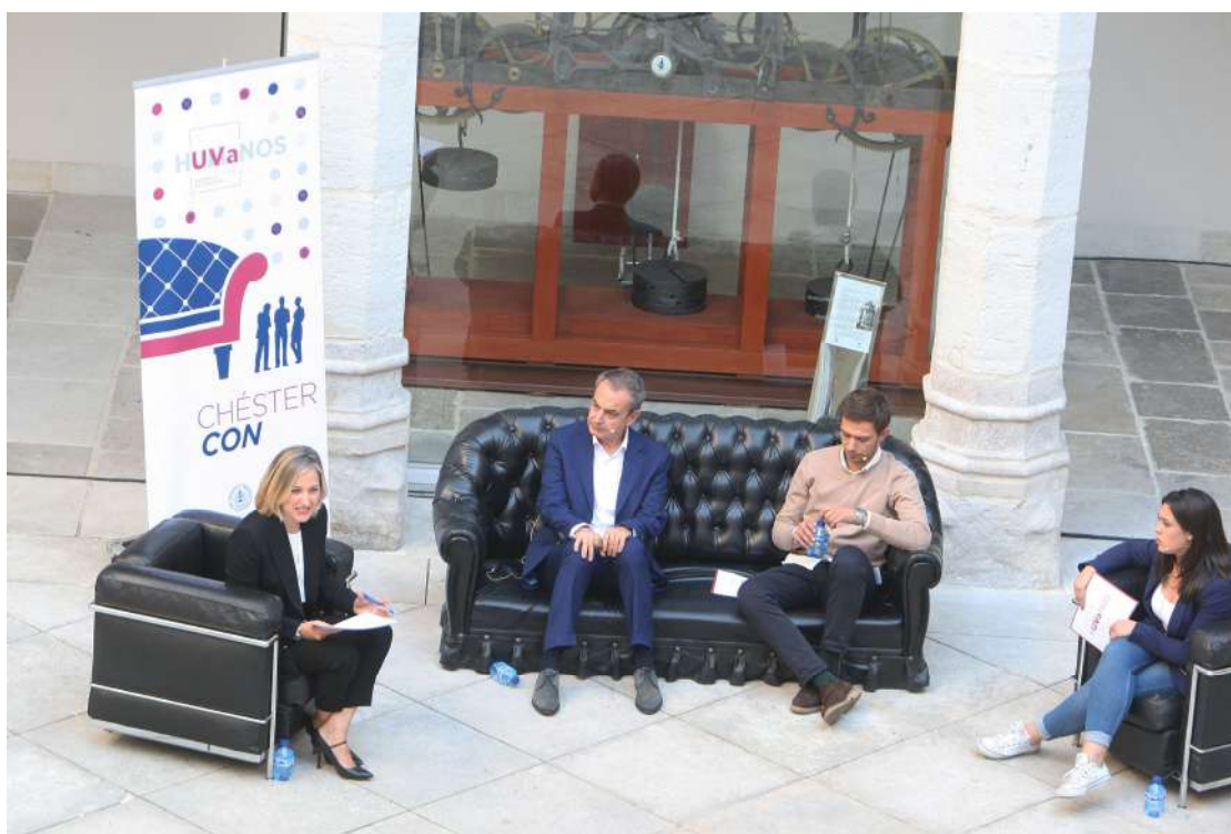
“Chester con...” José Luis Rodríguez Zapatero, expresidente del Gobierno, una de las actividades del Proyecto Humanos

El programa incluye diversas actividades que pretenden llenar, no sólo las aulas y pasillos de las distintas Facultades y Centros universitarios en general, sino también exportarlo a las calles y plazas de las ciudades de los cuatro campus.