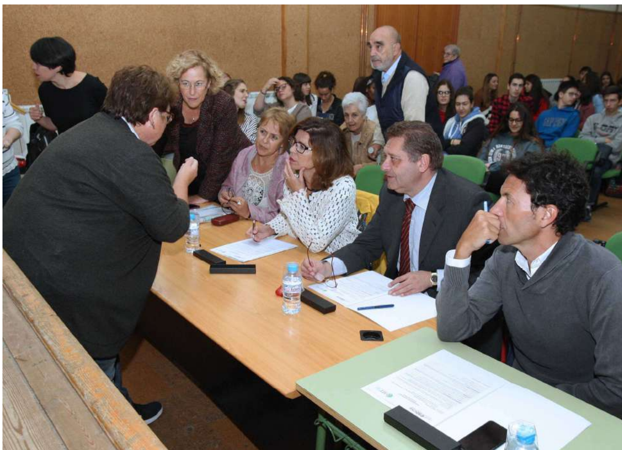
Instante en la deliberación del Jurado del concurso Three Minute Thesis (3MT)

Además, los ganadores reciben un reconocimiento de 100 euros por su participación. Un año más, el Consejo Social colaboró también económicamente con el concurso, dotándolo con 1.500 euros.