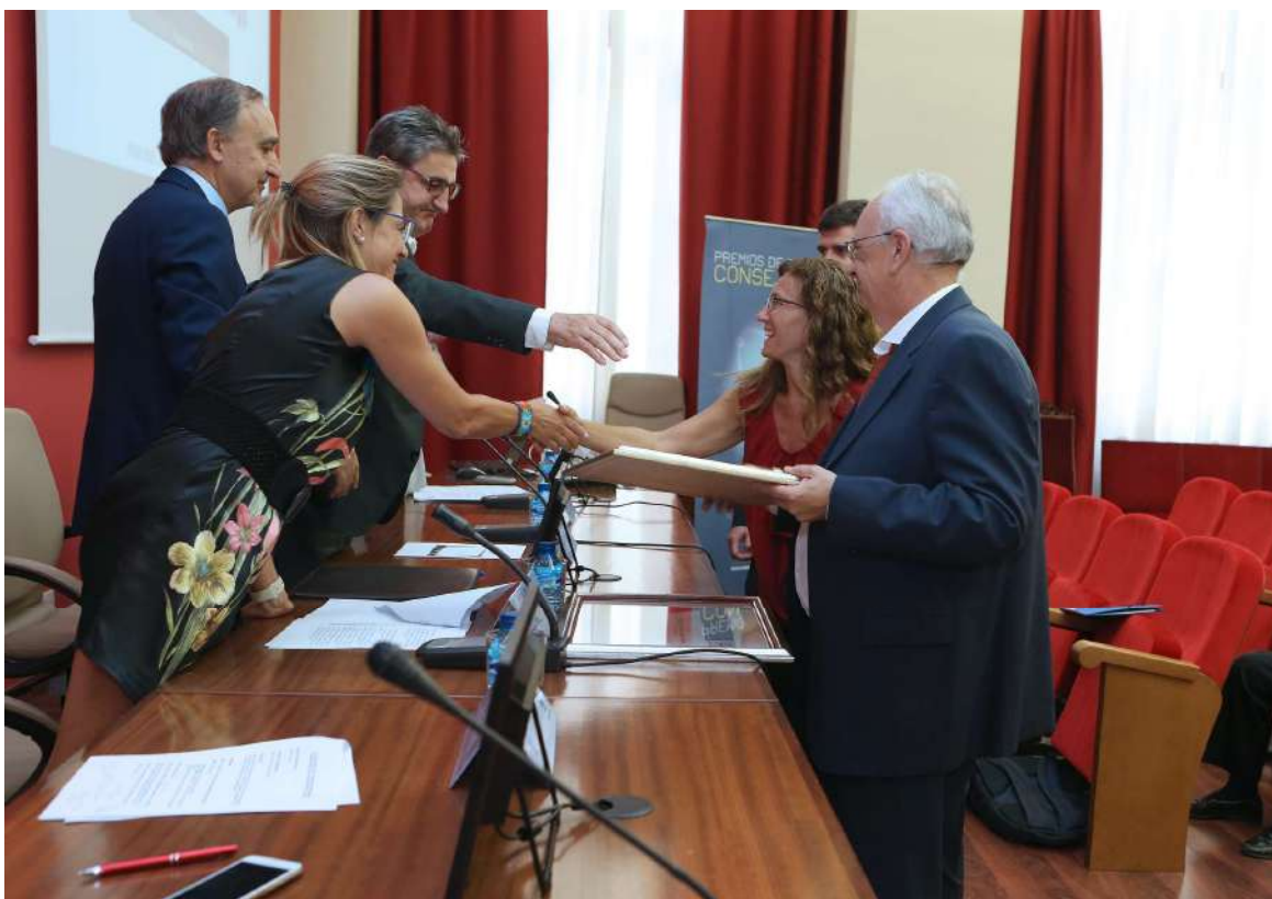
Instante de la entrega de los Premios de Investigación 2018