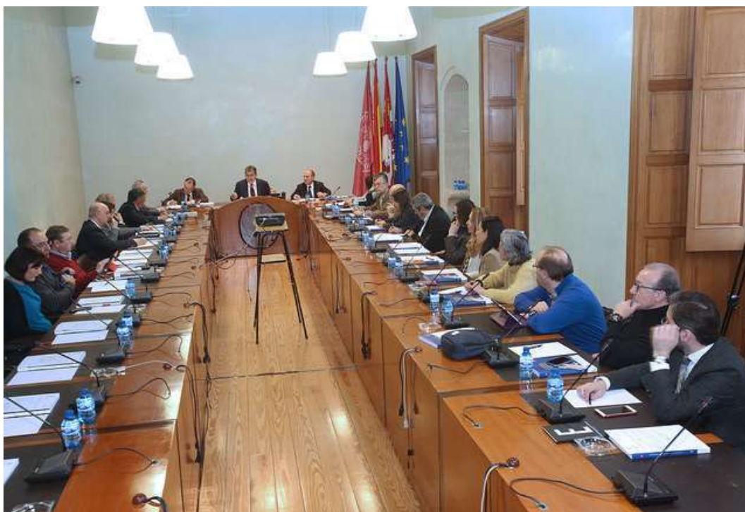
Desarrollo de una sesión plenaria del Consejo Social

El pleno de fecha 15 de diciembre de 2016 aprobó la denominación y composición de las Comisiones del Consejo Social: Comisión Económica, Comisión Académica, Comisión de Relaciones Sociales.