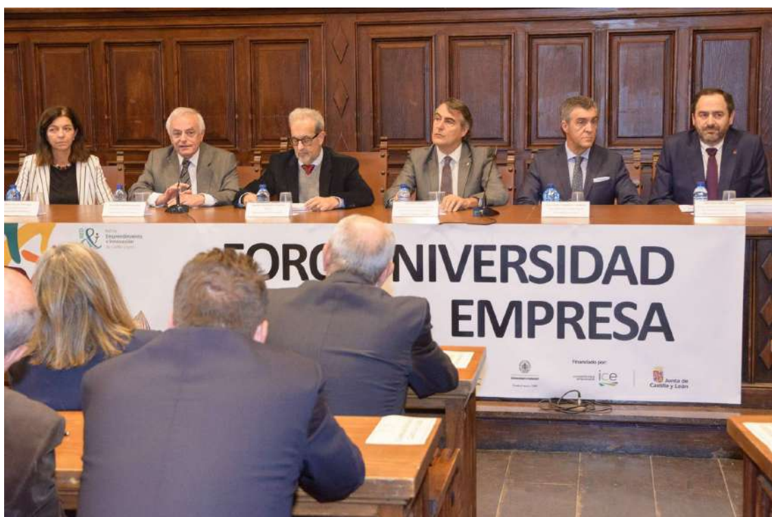
Presentación del Foro Universidad-Empresa en la Universidad de Salamanca

De este modo, la Universidad de Salamanca acogió la presentación inicial del estudio en un acto organizado por su Consejo Social el 30 de octubre de 2017 en el edificio histórico bajo el título “El futuro Laboral de las Humanidades en el mundo de las empresas”.