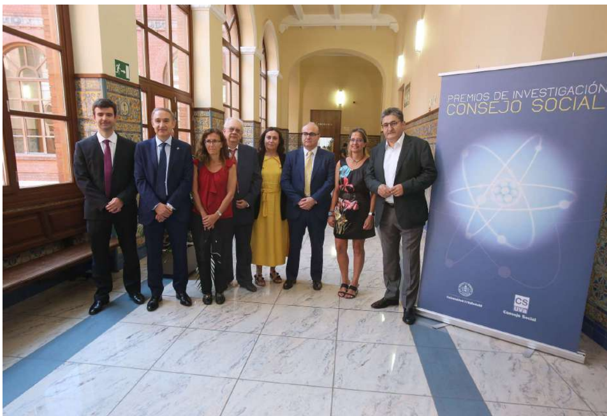
Foto de los premiados con la directora general de Universidades e Investigación, el rector de la UVa y el presidente del Consejo Social.

La relación de los premiados de los Premios de Investigación Consejo Social desde su constitución en el año 2008 es la siguiente: