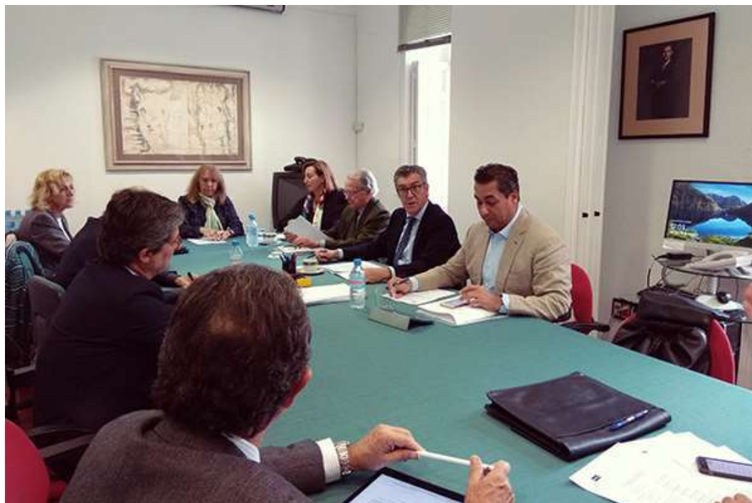
Reunión en Madrid de la Comisión Económica de la Conferencia de Consejos Sociales de Universidades Españolas

En esta reunión se trató sobre la presentación del estudio bajo el título “Una aproximación a los Sistemas de Financiación de las Universidades Públicas Españolas, encargado por la Conferencia, el Plan de acciones de la Comisión para 2019, la presentación del Presupuesto de la Conferencia de Consejos Social para 2019 y la organización de las Jornadas de la Conferencia de Consejos Sociales previstas realizar en Gran Canaria.