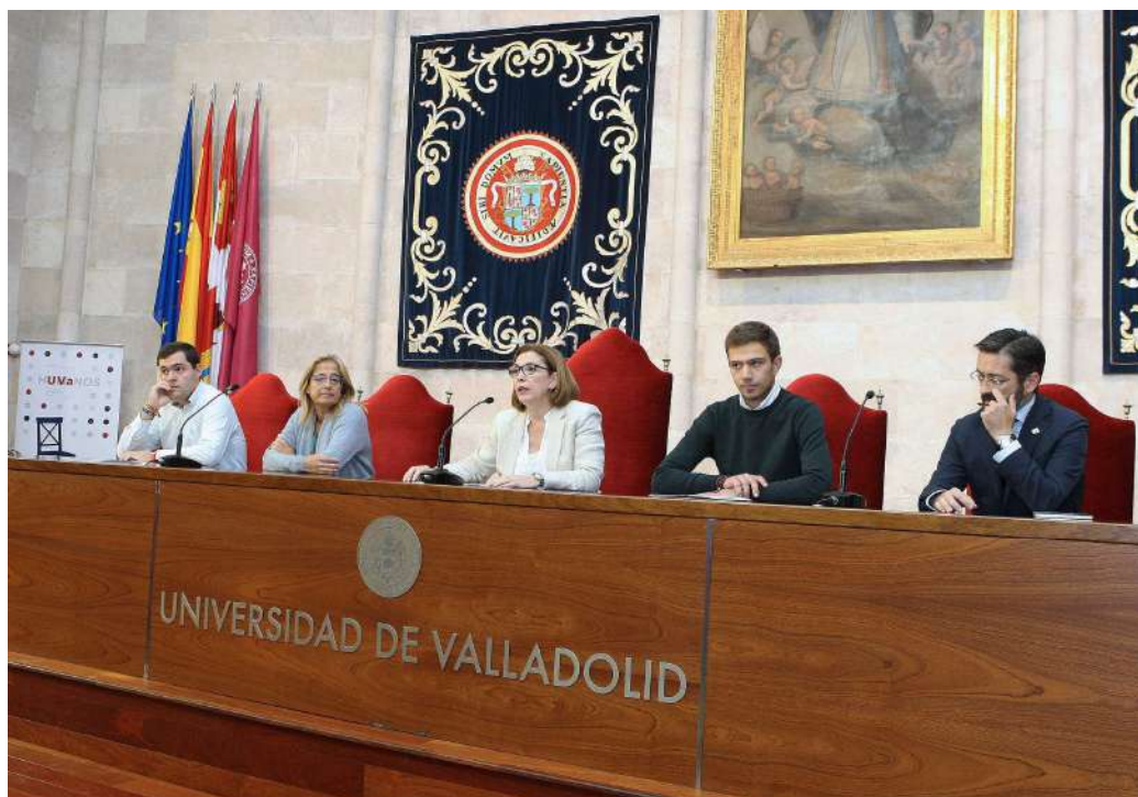
Acto de Presentación del Proyecto "Humanos"