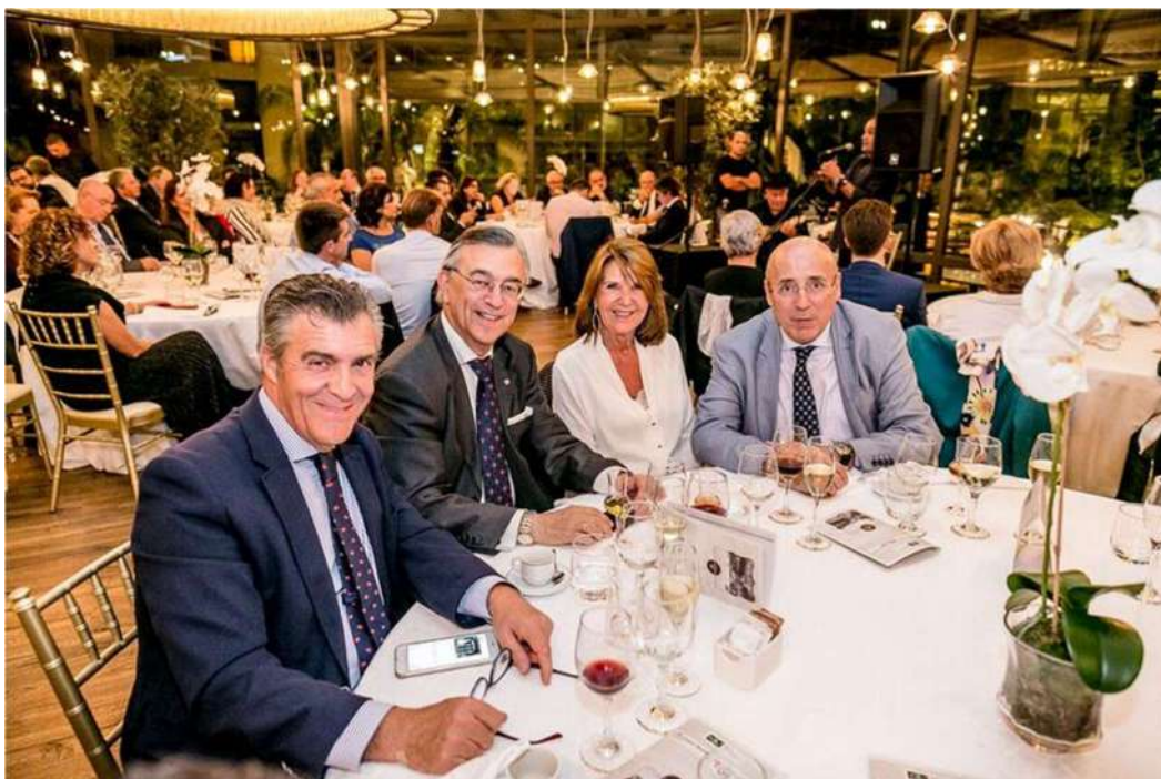
Instantes de descanso de los asistentes a las Jornadas

sistema universitario español, hacerlo más eficiente y atractivo para el atraer el talento y aumentar su financiación, darle más proyección internacional y hacer a la Universidad más útil para la sociedad. En este sentido, los Consejos Sociales se mostraron de acuerdo en que, para lograr estos objetivos, hay que trabajar intensamente en cuatro ejes: la mejora de la gobernanza, la reputación, la internacionalización y el compliance.