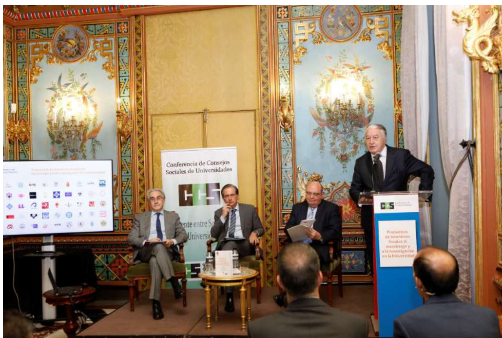
Presentación del Libro “Incentivos Fiscales al Mecenazgo y a la Investigación en la Universidad”

El libro, elaborado por un grupo de expertos, recoge el estudio y análisis de la situación actual del mecenazgo privado en España y se proponen medidas concretas para consolidar un régimen fiscal atractivo para mejorar la financiación privada de las universidades.