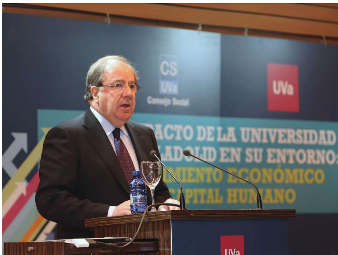
El presidente de la Junta de Castilla y León, Juan Vicente Herrera, durante su intervención en la presentación del estudio