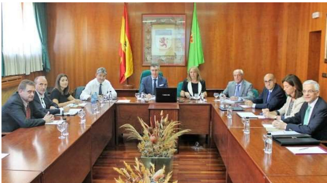
Tercera reunión, esta vez en León, del Foro de CC.SS. de Castilla y León

Además, en dicho encuentro se trataron temas como el estudio y debate del borrador de indicadores comunes de seguimiento de los resultados docentes, investigadores y de transferencia de conocimiento, y el seguimiento de las gestiones realizadas en torno a la dependencia orgánica y funcional de los servicios de control interno respecto del Consejo Social.