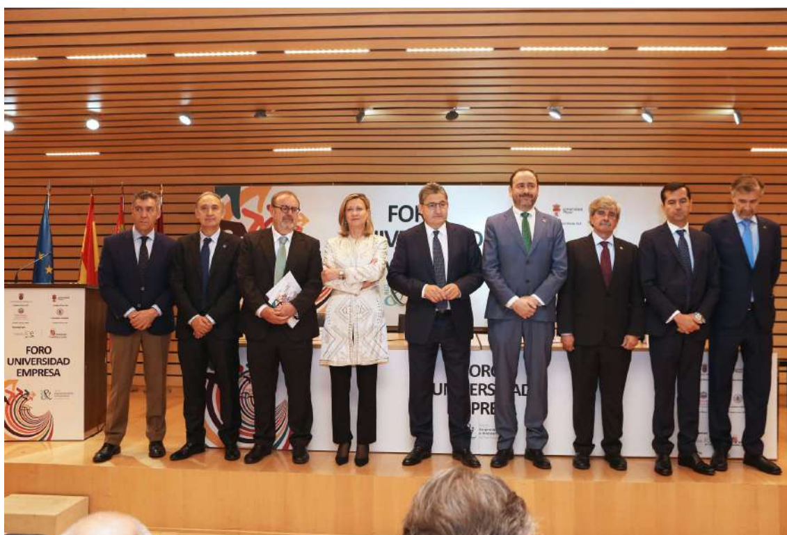
Participantes en el acto de presentación del estudio