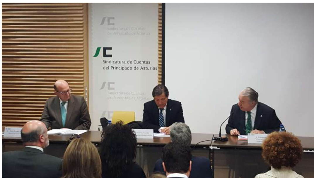
Encuentro de CCSS con el Tribunal de Cuentas

El encuentro estuvo organizado por el Consejo Social de la Universidad de Oviedo, el Tribunal de Cuentas y la Conferencia de Consejos Sociales (CCS), y contó con la presencia de una amplia representación del órgano de fiscalización. La jornada versó sobre la transparencia, destacándose la importancia de la misma en la gestión del dinero público por parte de la Administración en general y la Universidad en particular y se hizo hincapié en la necesidad de que el Tribunal de Cuentas y la Conferencia de CCSS reflexionen de manera conjunta sobre este aspecto como medio eficaz de alcanzar y ganar la confianza de los ciudadanos.