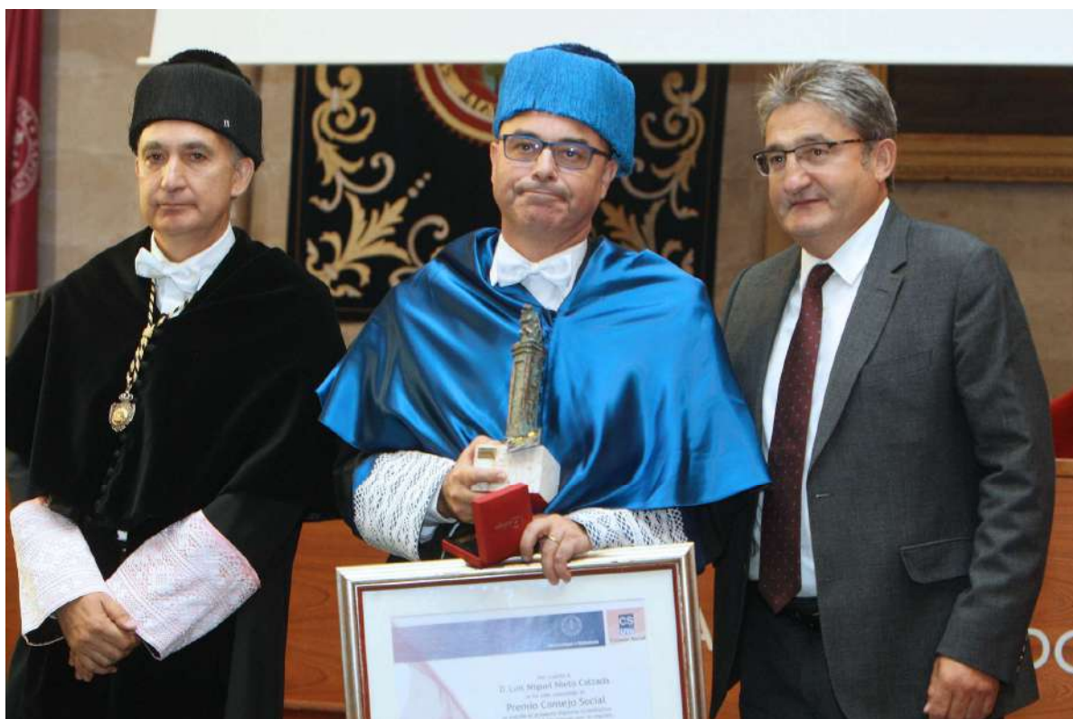
El presidente del Consejo Social y el rector de la UVa posan con el premiado