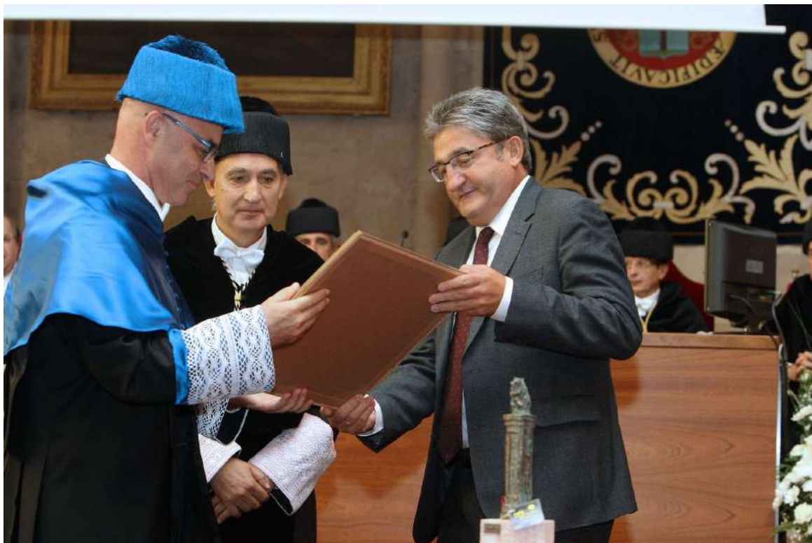
El presidente del Consejo Social hace entrega al premiado del diploma fedatario del galardón