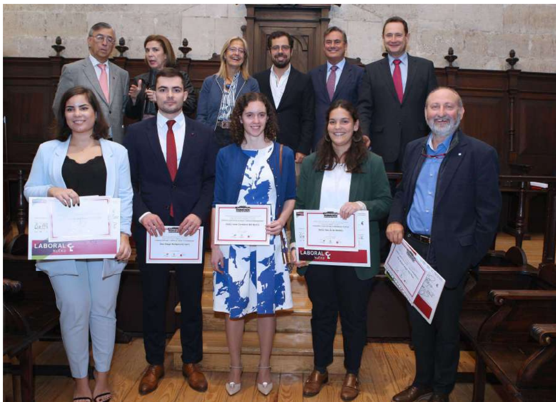
Acto de entrega de los premios al Compromiso Universitario

Estos galardones están organizados por la Fundación Schola con el patrocinio de Laboral Kutxa y la colaboración activa del Consejo Social y de la Dirección General de la Juventud de la Junta de Castilla y León, y tienen como finalidad reconocer el compromiso social de los estudiantes de los centros universitarios integrados en cualquiera de los campus de la UVa (Valladolid, Palencia, Soria y Segovia).