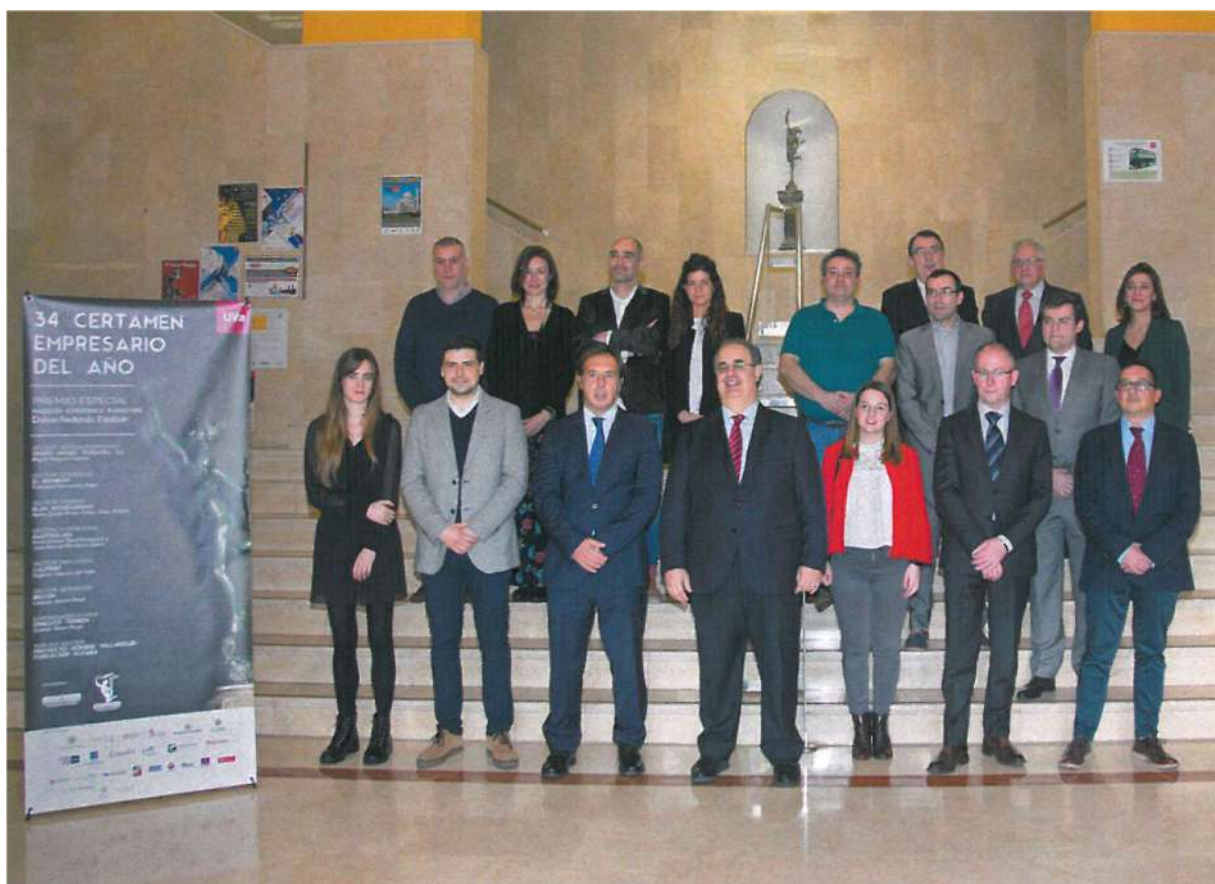
Recepción de Premiados del 34 Certamen Empresario del Año