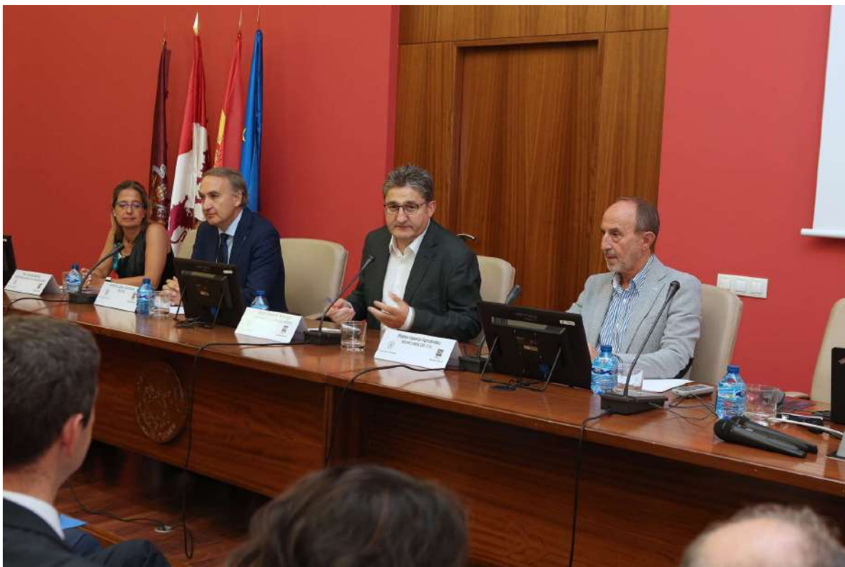
Intervención del presidente del Consejo Social durante el acto de entrega de los Premios de Investigación

Uno de los principales objetivos y mandatos legales que tiene los Consejos Sociales de la Universidades españolas es el de establecer una interrelación entre los intereses, fines y aspiraciones de la Sociedad, y hacerlos partícipes en coexistencia con los de las Universidades.