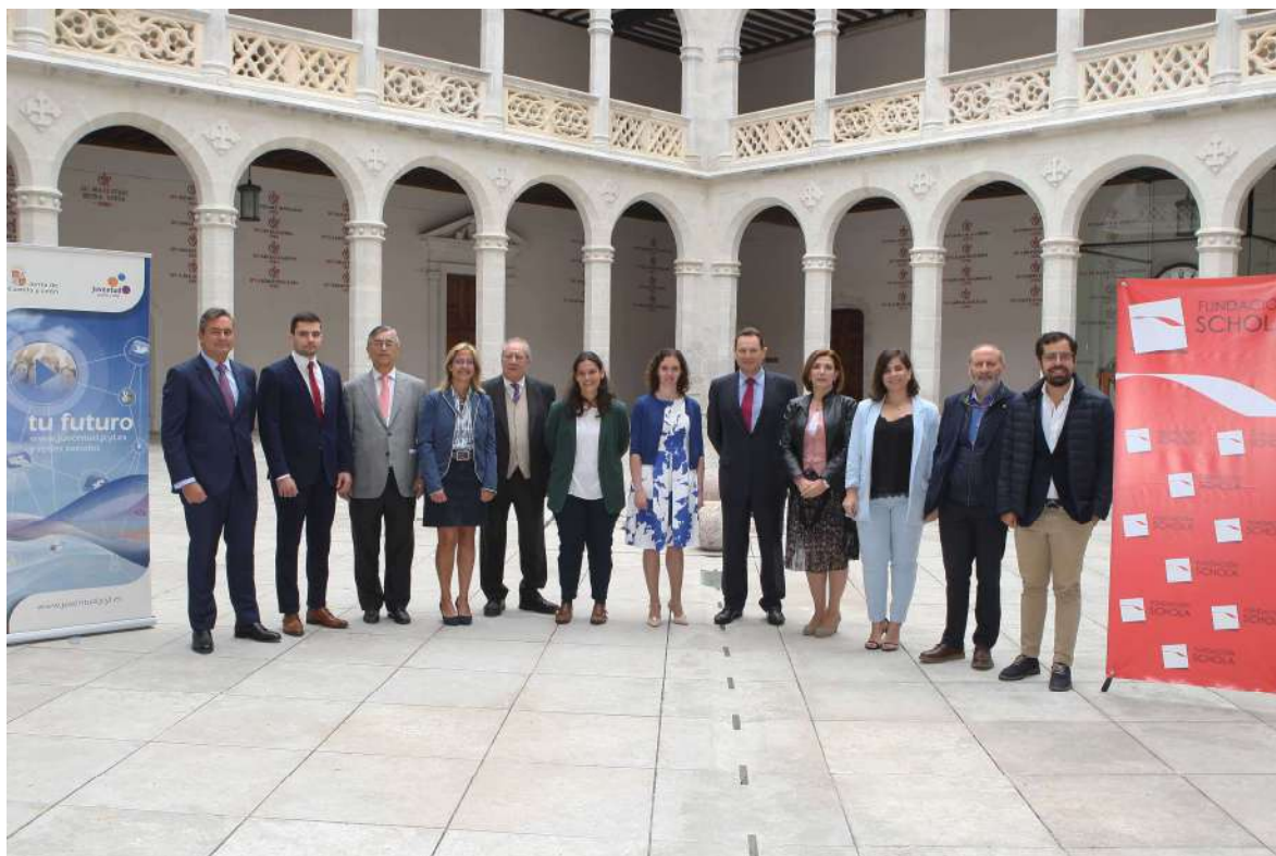
Foto de los premiados con el jurado

En esta edición se concedieron tres premios dotados con 1.000 euros cada uno, en las categorías de Ciencias Sociales y Jurídicas, Artes y Humanidades; Ciencias, Ciencias de la Salud y Ciencias Experimentales; e Ingeniería y Arquitectura o Enseñanzas Técnicas, y dos finalistas